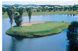
The Palms ザ・パームズ

2001年、豪州でトップ10に入る名門コースです。コース内のアンジュレーションも多彩で、様々なシチュエーションが楽しめます。起伏はありませんが、速いベントグリーンや点在する池を攻略するのに高い戦略性が要求されます。