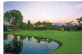
Emerald Lakes エメラルドレイクス

全体的にフラットでフェアウェイは広々としているが、ポイントにウォーターハザードが点在するなど、ビギナーから上級者まで楽しめるグラハムマーシュ設計のコース。