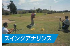
スイングアナリシス

ショット練習は、ラウンドと同じ状況で練習できるからこそ意味があり、大きな自信となるのです。プレー中の感覚と集中力を養うことで、実戦での余裕が生まれることでしよう。