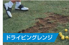
ドライビングレンジ