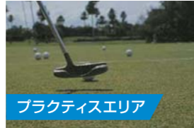
プラクティスエリア