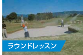
ラウンドレッスン